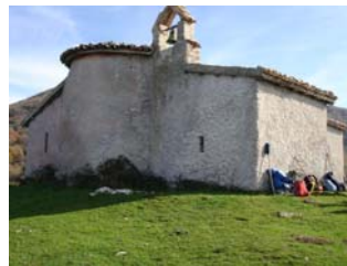
Chiesa di San Martino