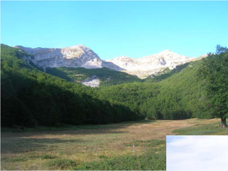
Piani di Pezza