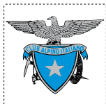
Club Alpino Italiano Sezione di Loreto Aprutino

E inoltre, sarà presentato il sentiero "Torre delle Valli" presso l'Azienda Agrituristica "Pollinaria".