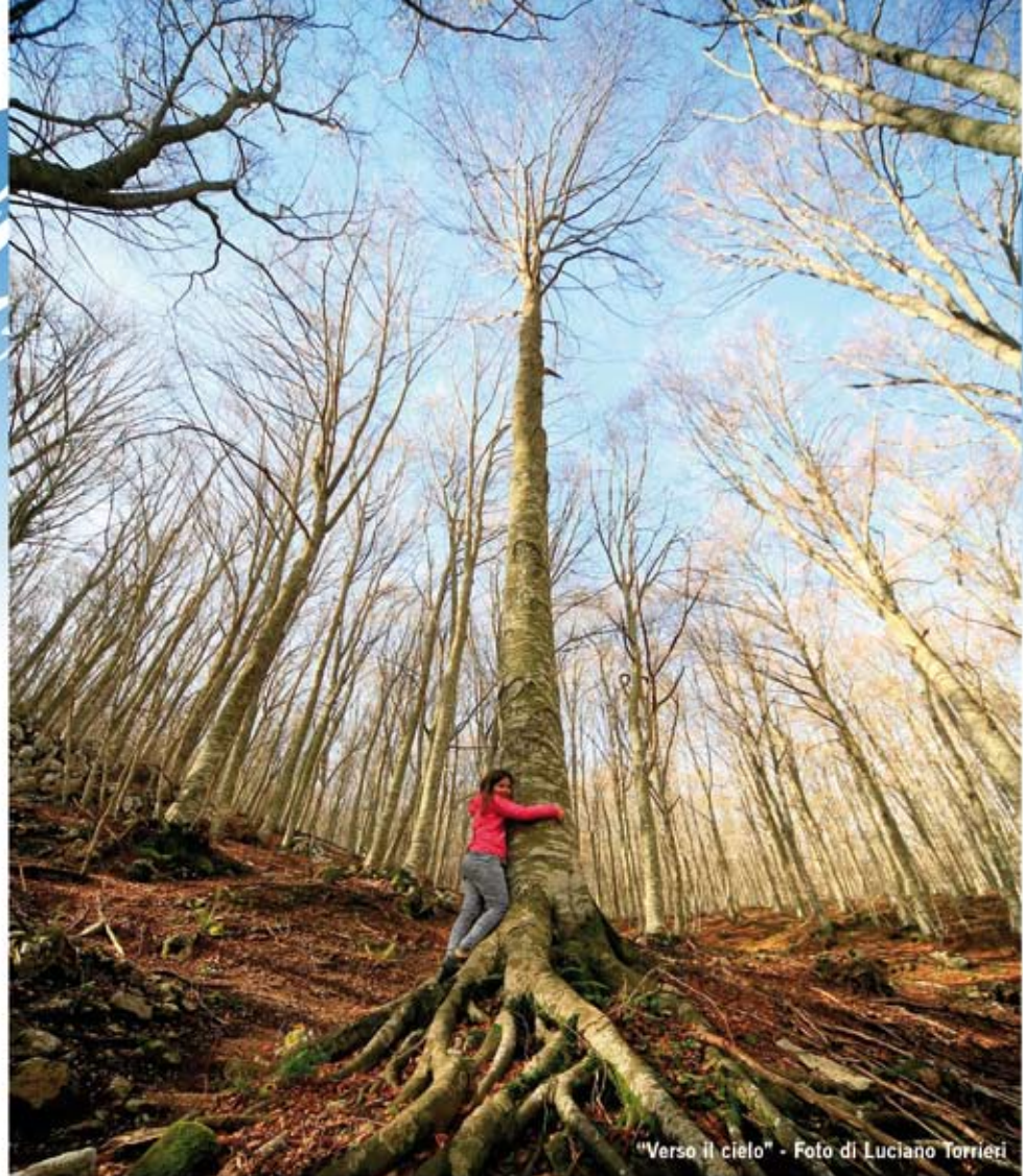
"Verso il cielo"