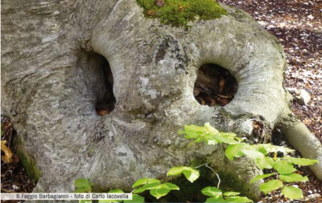
Il Faggio Barbagianni