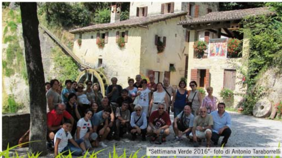
"Settimana Verde 2016"

Itinerario in ambienti innevati che richiedono l'utilizzo di racchette da neve oltre ad una adeguata attrezzatura.