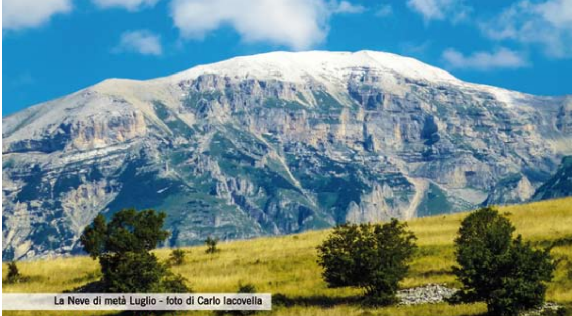
La Neve di metà Luglio - foto di Carlo Iacovella