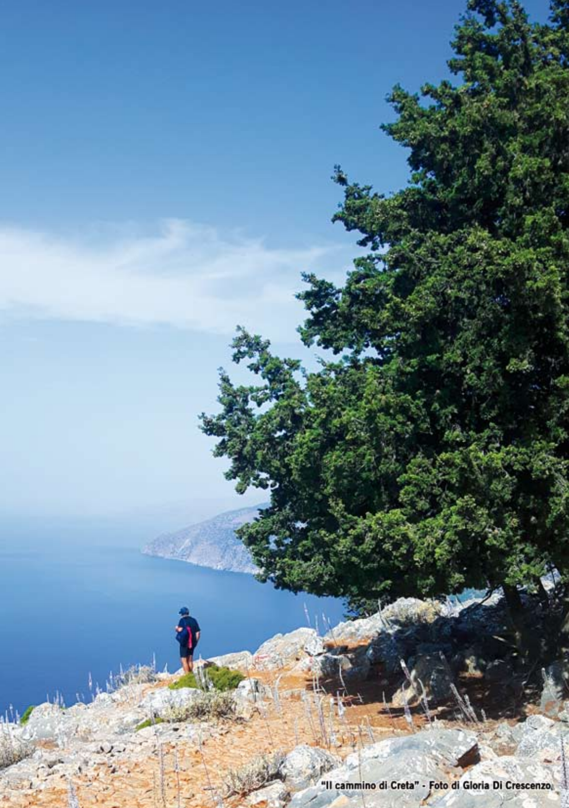
"Il cammino di Creta"