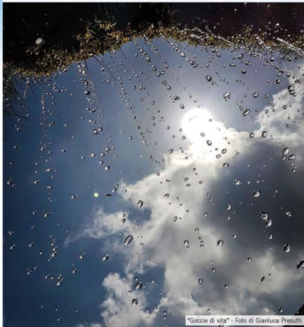
"Gocce di vita"

TEMPO COMPLESSIVO A/R: ore 4 - DIFFICOLTA' : EAI - DISLIVELLO A SALIRE : 300 mt