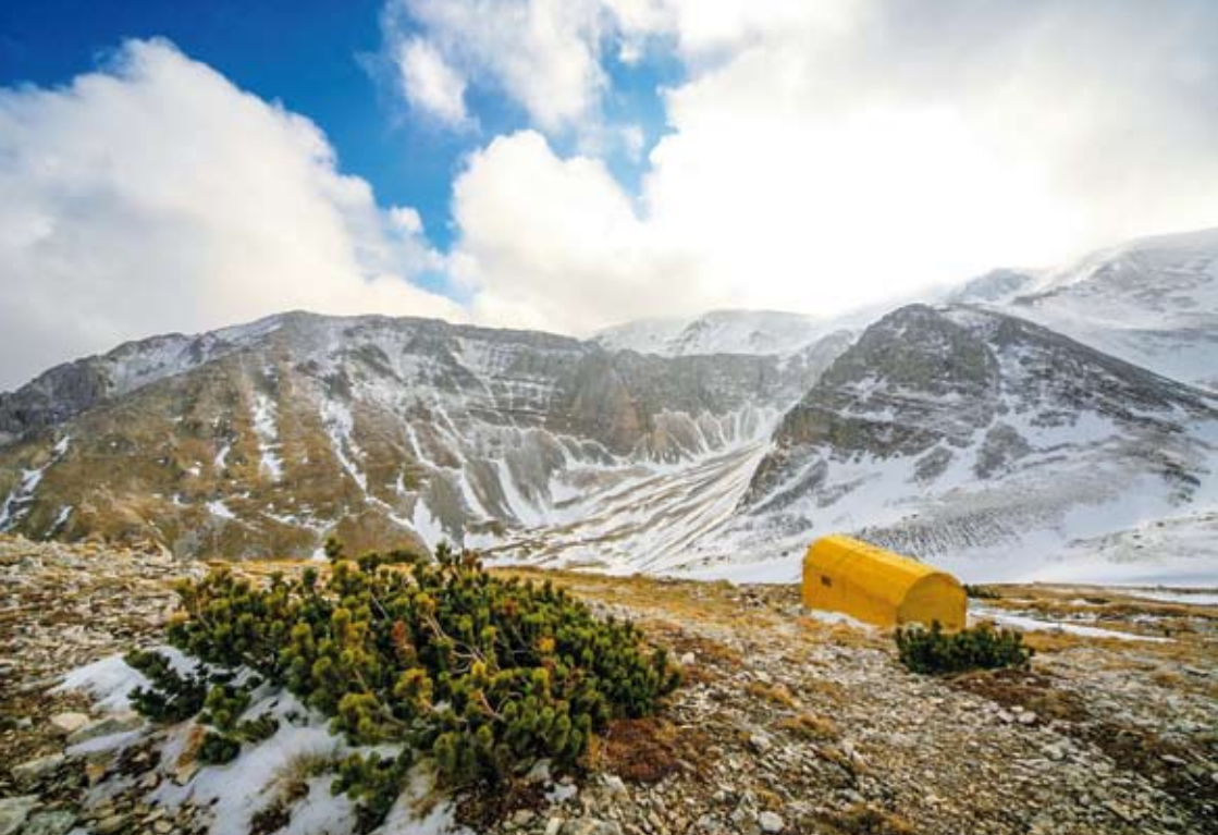
"Panoramica dal Bivacco C. Fusco"