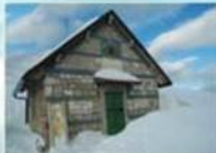
CAI Coppo dell'Orso