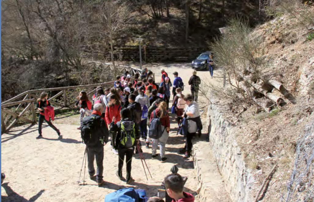
Alla "Madonna Fore" con la Scuola Media "Dante Alighieri" dell'Aquila