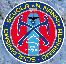
Salita alpinistica al Corno Piccolo

continuità per favorire la consapevolezza delle proprie possibilità. La Sezione organizza un corso di allenamento specifico per l'alpinismo e lo scialpinismo, a corpo libero, per prepararci alle uscite in ambiente. Il corso avrà una struttura semplice, alternando sedute di potenziamento/mantenimento muscolare a sedute di allungamento e lavori sulla propriocezione e l'equilibrio. Gli esercizi saranno facilmente replicabili a casa. Attrezzatura necessaria: tappetino da yoga, scarpe da ginnastica, elastici e palla piccola da pilates.