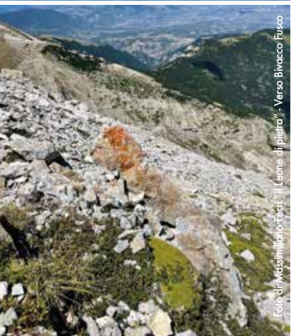
Foto di Massimo Lupo - Ferrini "Il Leone di pietra" - Verso Bivacco Fusco