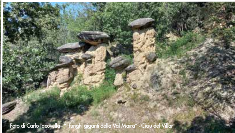
"I funghi giganti della Val Maira" - Ciciu del Villar