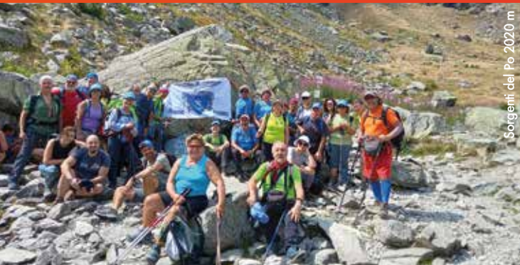
Sorgenti del Po 2020 m