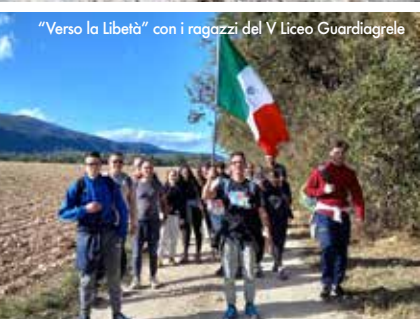
"Verso la Libertà" con i ragazzi del V Liceo Guardiagrele