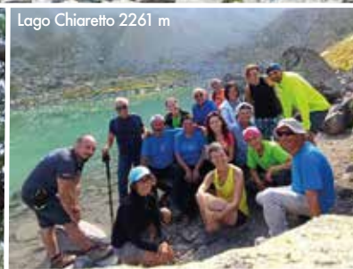
Lago Chiaretto 2261 m