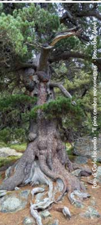
"Il pino cembro monumentale" - Bosco dell'Alve