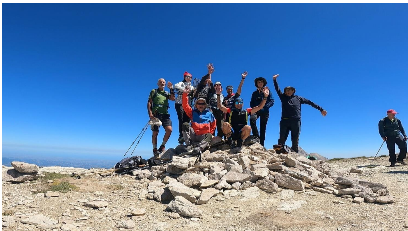
In vetta del Monte Corvo, 13 Agosto 2023