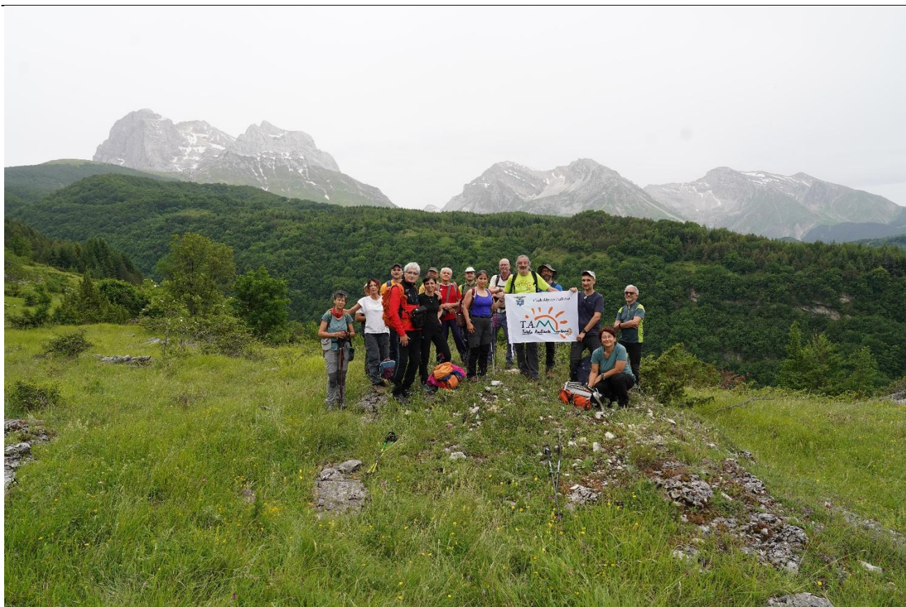
"In Cammino nei Parchi" nel territorio del Montagnone, 9 giugno 2024.